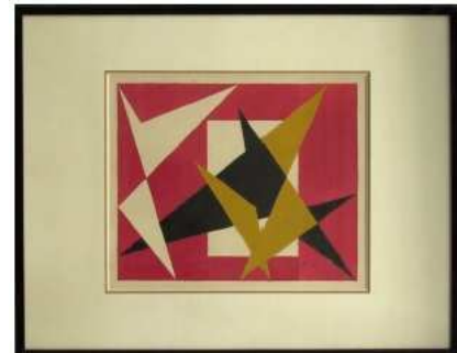
« Abstraction aux triangles », Melito

Il utilise les lignes et les formes géométriques simples dans sa peinture.